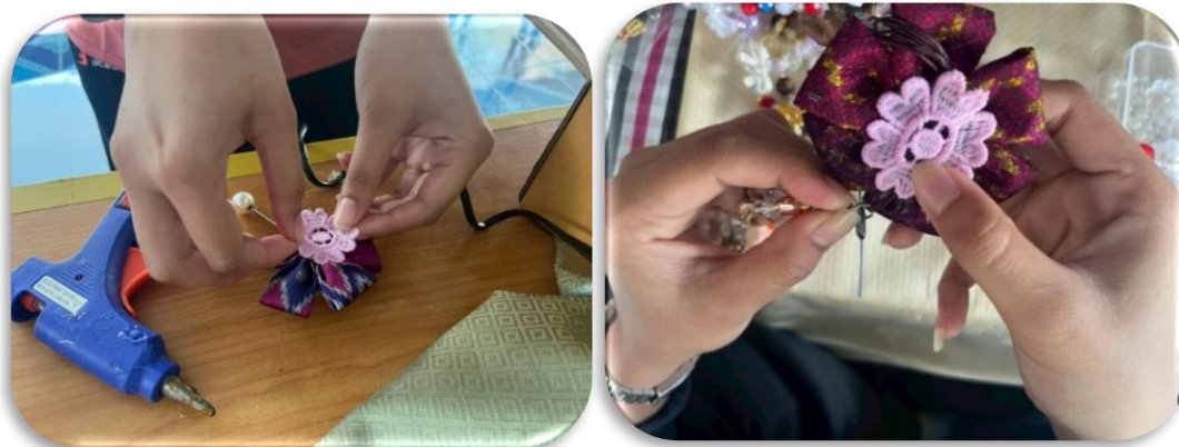
รูปภาพที่1.10 ประกอบเป็นพวงกุญแจ เข็มกลัด หรือห้อยโทรศัพท์