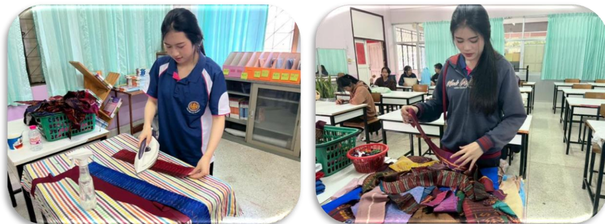
รูปภาพที่ 1.2 คัดเลือกเศษผ้าไหมมารีดให้เรียบ