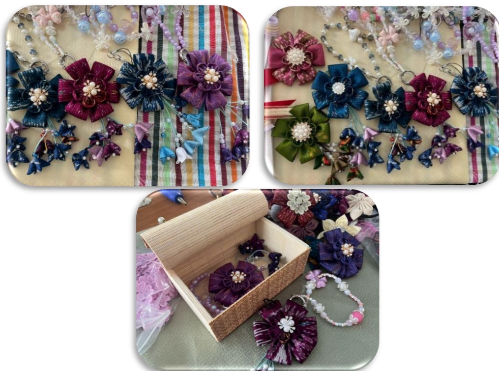
รูปภาพที่1.11 การตกแต่งกล่องบรรจุภัณฑ์