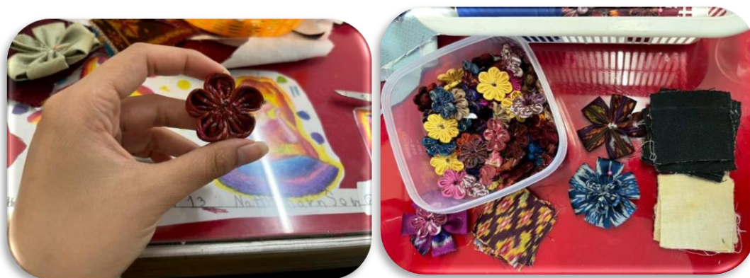
รูปภาพที่1.7 เย็บกริบบดอกเข้าด้วยกันตามแบบ