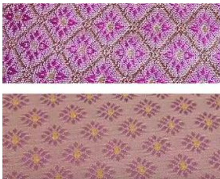
รูปภาพที่ 5 ผ้าไหมลายดอกพิกุล