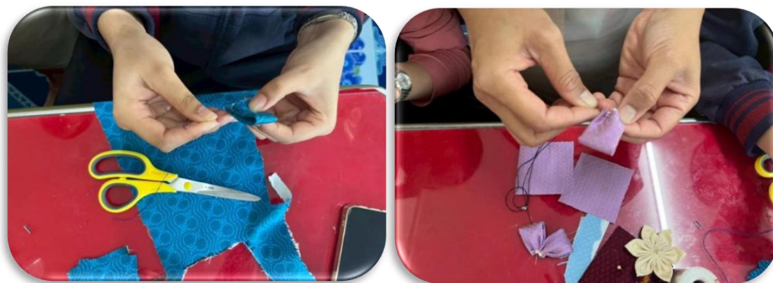
รูปภาพที่1.6 พับผ้าให้ได้ตามกริบบดอกไม้ที่ออกแบบไว้ เช่นดอกบัวบาน ดอกแก้ว