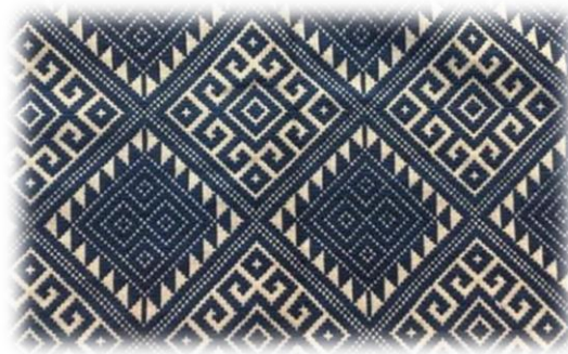
รูปภาพ 4 ภาพผ้าซิด