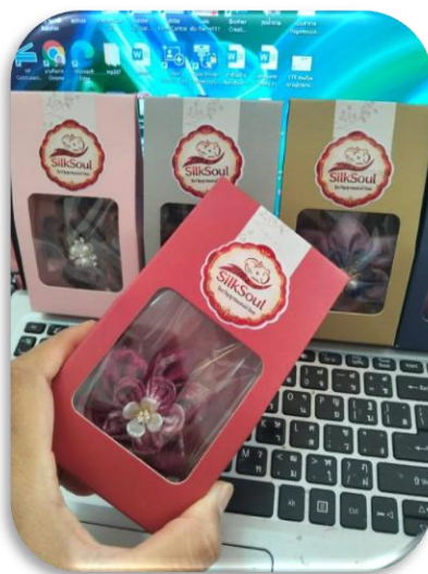
รูปภาพที่1.12 ผลิตภัณฑ์ระลึก สำเร็จ บรรจุลงกล่องบรรจุภัณฑ์