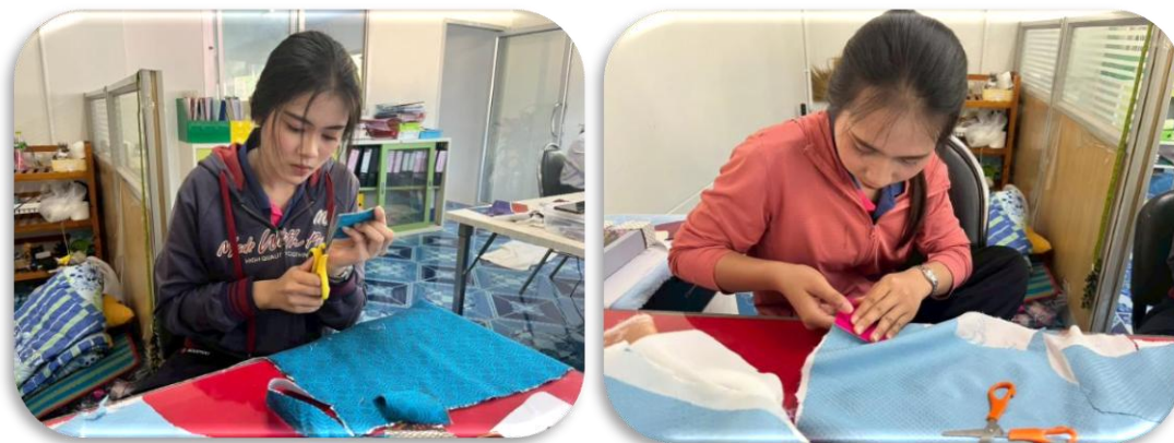
รูปภาพที่ 1.4 นำผ้าที่อัดผ้ากาวไว้มาตัดเป็นรูปสี่เหลี่ยม และวงกลมตามขนาดที่ต้องการ