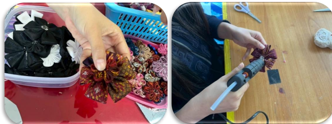
รูปภาพที่1.8 นำดอกไม้ 2 ขนาดมาติดกาวให้แน่น