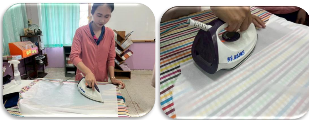
รูปภาพที่ 1.3 นำเศษผ้าไหมที่รีดไว้มารีดอัดกับผ้าขาว