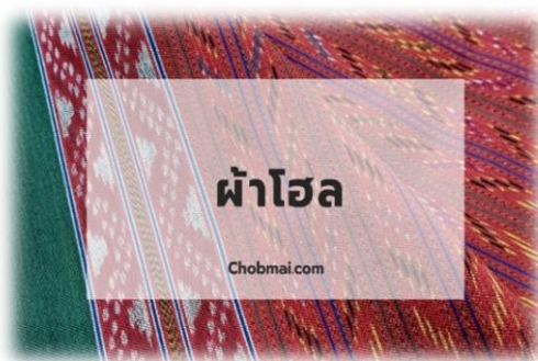
รูปภาพ 1 ภาพผ้าไหมสุรินทร์ “ผ้าโฮล”

ผ้าไหม ลายโฮลผู้หญิง (โฮลสะไรย์) เป็นผ้ามัดหมี่ที่เกิดจากการมัดหมี่ลวดลายเดียวกันกับ ผ้าโฮลเปราะห์ แต่เมื่อนำมาทอจะใช้วิธีการดึงลายให้เกิดลวดลาย อีกแบบหนึ่ง และเพิ่มองค์ประกอบของลวดลายเพิ่มเข้าไป คือมีลายสายฝน ทางกระรอกและคันด้วยเส้นพื้นสีแดงครึ่งเป็นต้น ซึ่งแตกต่างจากลายโฮลเปราะห์ เอกลักษณะอย่างหนึ่งของผ้า คือบริเวณริมผ้าจะมีเส้นสันนูนขนานไปกันทั้งสองด้าน ในทิศของแนวเส้นพุ่งอันเนื่องจากการจัดลวดลายแล้ว ม้วนเส้นไหม ที่เหลือสอดเข้าในช่องว่างของเส้นยืน จากนั้นทอทับ ทำให้ริมผ้าของผ้ามัดหมี่สุรินทร์มีความหนาและแข็งแรง