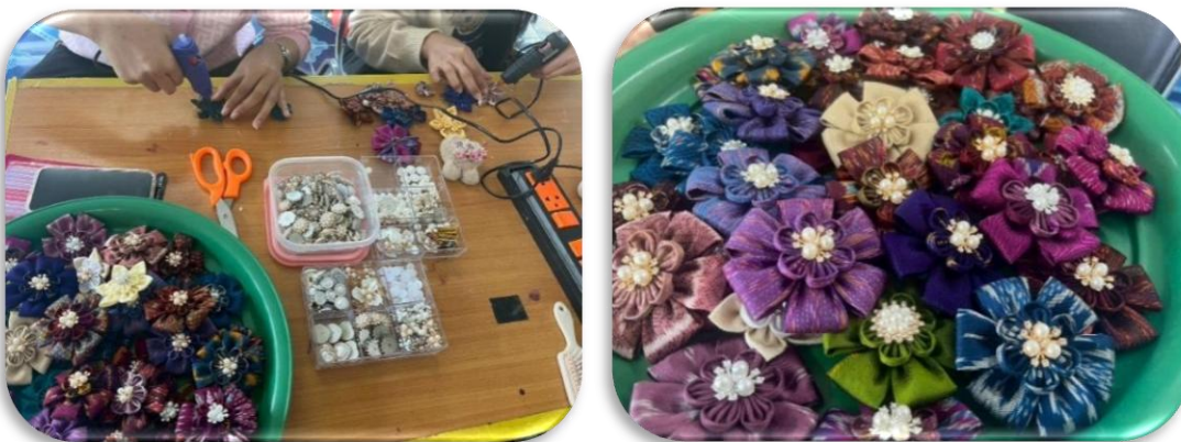
รูปภาพที่1.9 ประดับเข้ากับลูกปัด