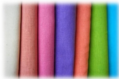
รูปภาพ 2 ภาพผ้าฝ้าย

ผ้าฝ้าย เป็นผ้าทอจากเส้นใยฝ้าย ซึ่งในประเทศไทยสามารถปลูกฝ้ายได้ทุกภูมิภาค เกษตรกรจะปลูกฝ้ายไปพร้อมกับการทำนา ประมาณเดือนพฤศจิกายน ถึงเดือนธันวาคม ฝ้ายจะแก่และแตกปุย นำมาผลิตเป็นใยฝ้าย เพื่อใช้ทอผ้าหลังฤดูเก็บเกี่ยวต่อไป