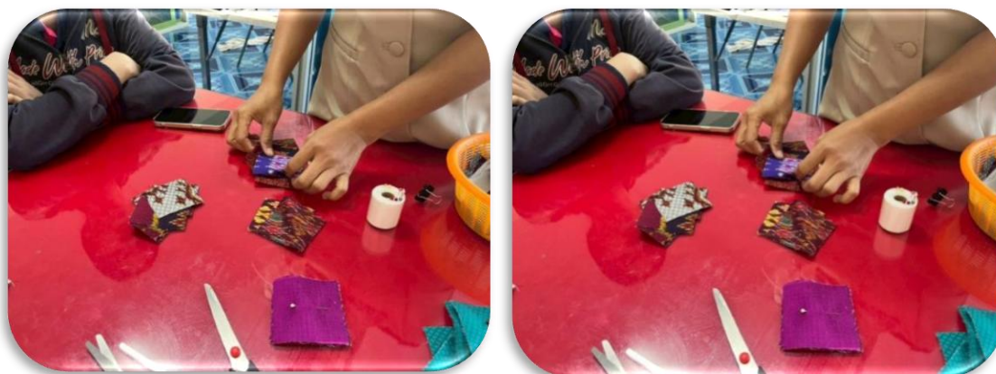
รูปภาพที่1.5 เลือกผ้าที่ตัดมาจัดไว้เป็นชุด ชุดละ5 - 6แผ่น